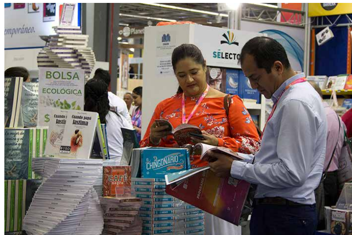
Los sistemas de validación del libro tradicionales comienzan a entrar en crisis.

Los sistemas de validación del libro tradicionales comienzan a entrar en crisis, frente a una valoración directa de los contenidos de parte de los propios lectores, que opinan y califican los contenidos, e incluso potencian las ventas de un título con sus opiniones. Es el caso de las redes sociales de lectura