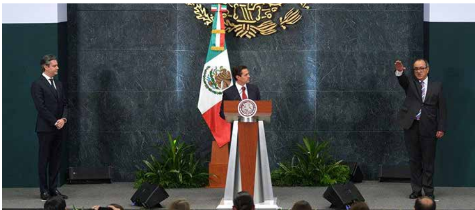
Toma de protesta del Mtro. Otto Granados como secretario de Educación Pública.

En el mismo sentido, y en lo que fue su primera reunión de trabajo con los trabajadores de la Secretaría de Educación Pública, Granados Roldán exhortó a su equipo de trabajo a redoblar el ritmo para dar plena continuidad y consolidar la Reforma Educativa y las políticas públicas del Nuevo Modelo Educativo, e instruyó dar atención