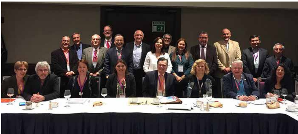
Grupo de trabajo del GIE.

Asimismo, Marifé Boix, subdirectora de la Feria de Fráncfort, invitó a los presentes a hablar con